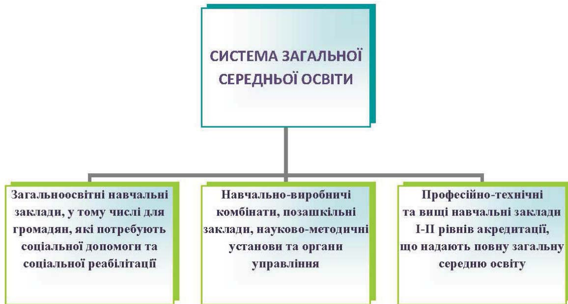
Рис. 1. Система загальної середньої освіти в Україні

Міністерство освіти і науки України. Більшість планових, керівних і контрольних функцій управління освітою належить МОН України. Його повноваження та функції визначено законами України «Про освіту», «Про загальну середню освіту», «Про професійно-технічну освіту», «Положенням про Міністерство освіти і науки України».