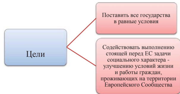
Рис. 1. Цели включения принципа равной оплаты труда в Договор о создании Европейского экономического сообщества

Первый этап (начинается с принятием Договора о функционировании Европейского Союза, который до вступления в силу Лиссабонского договора именовался Договором об учреждении Европейского сообщества или Римским договором, действует с 1958 года) связан с первыми попытками органов ЕС «внедрить» гендерное равенство в законодательство ЕС. Непосредственное отношение к правовому регулированию гендерного равенства на этом этапе имеет Римский договор 1957 г. Он содержит специальную статью (ст. 119), определяющую правовой статус работающей женщины. Эта статья обязывает государства – члены Европейского Союза гарантировать и соблюдать принцип, согласно которому мужчины и женщины должны получать равную оплату за одинаковый труд [9]. Данный принцип был включен в Договор о создании Европейского экономического сообщества, что преследовало две цели (рис. 1).